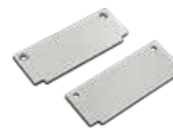
KIT DE 2 TAPAS IL210110