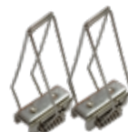
KIT DE 2 CLIPS DE MONTAJE (TIPO SOPORTE) IL210086