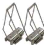
KIT DE 2 CLIPS DE MONTAJE (TIPO SOPORTE) IL210081